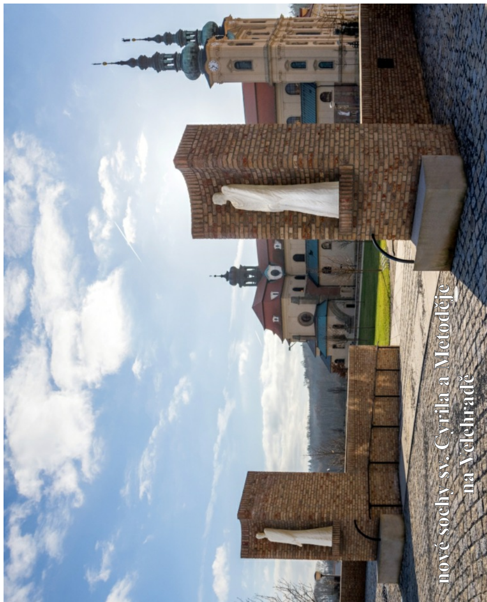
nové sochy sv. Cyrila a Metoděje na Velehradě