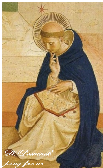
St. Dominik, pray for us

https://svetkrestanstva.postoj.sk/15911/na-stredoveku-milujem-slobodu