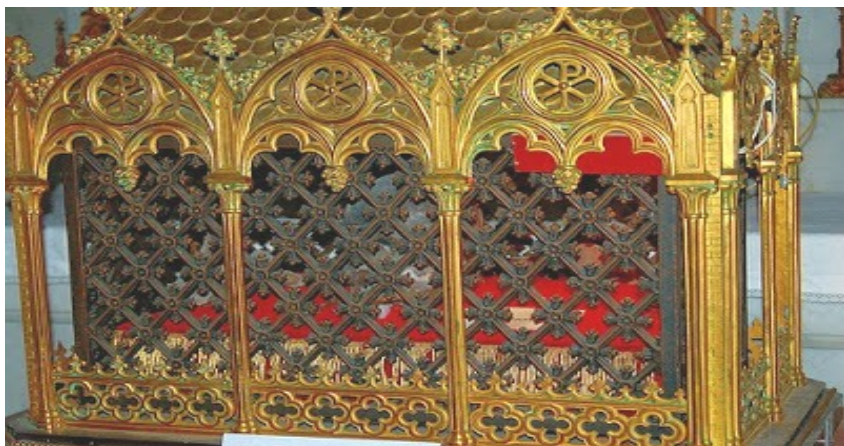
Relikviár s ostatky sv. Antonína Veľikého

Svätý Anton zomrel okolo roku 356 vo svojej malej jaskyni v horách neďaleko Červeného mora, jeho ostatky sa v priebehu histórie nakoniec ocitli vo Francúzsku a sú uložené v kostole v meste Arles.