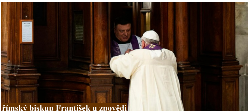
římský biskup František u zpovědi

You are asking me an important question. I would say two things. The first: Naturally, if you kneel down and, with true love for God, pray that God forgives you, He forgives you. It has always been the teaching of the Church that [if] one, with true repentance ... asks for forgiveness, he is pardoned by God. This is the first part. If I honestly know that I have done evil, and if a love for goodness, a desire for goodness, is reborn within me ... and I ask forgiveness of God ... He gives it to me.