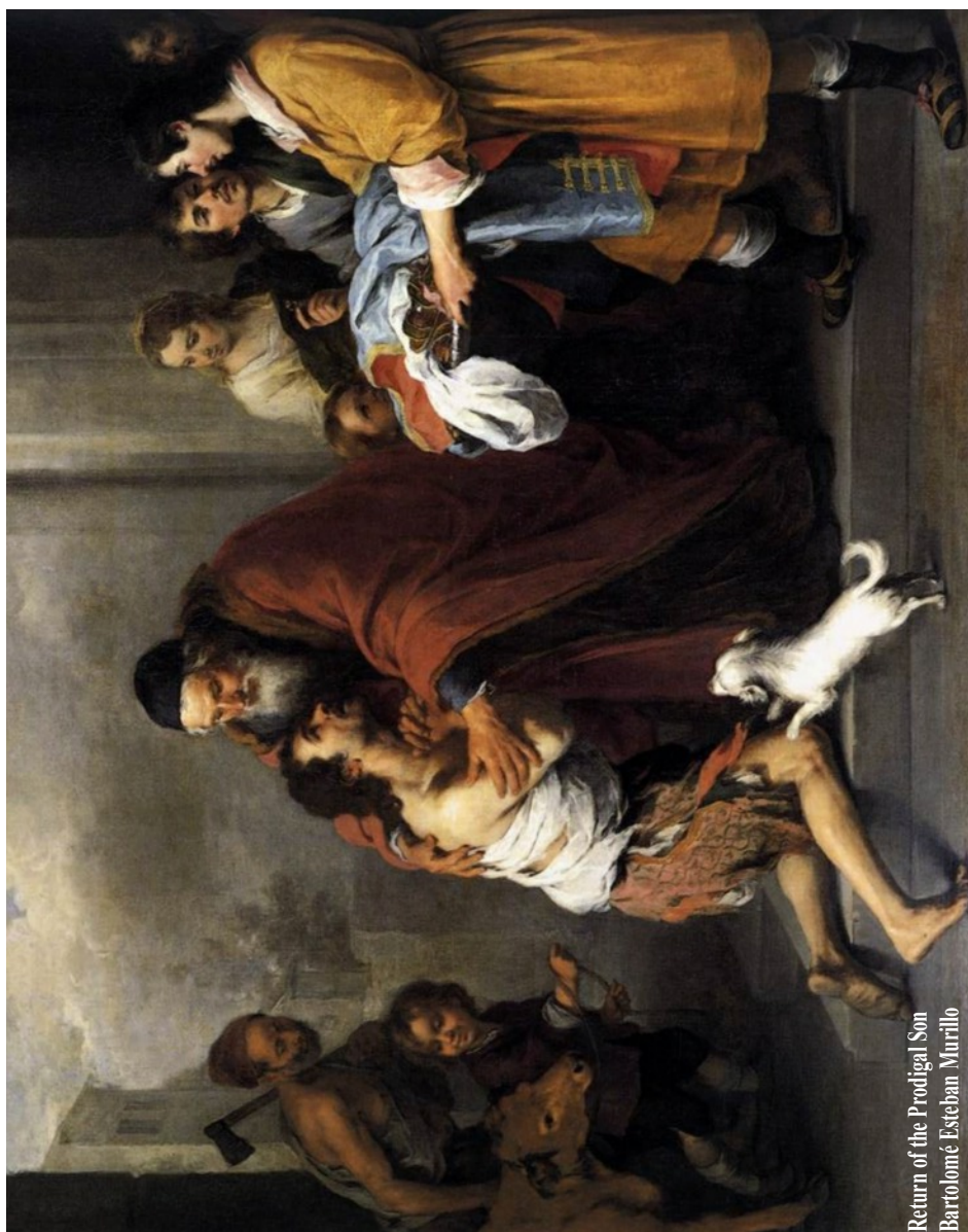
Return of the Prodigal Son Bartolomé Esteban Murillo